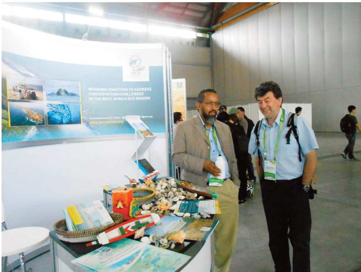
Le stand du PRCM lors du Congrès mondial des Parcs

Pour donner plus de visibilité aux actions du PRCM et de ses membres, un stand d'exposition a été animé par le PRCM durant toute la période du Congrès. Il a également servi de cadre de rencontres et de présentation de leurs produits par les membres et partenaires du PRCM.