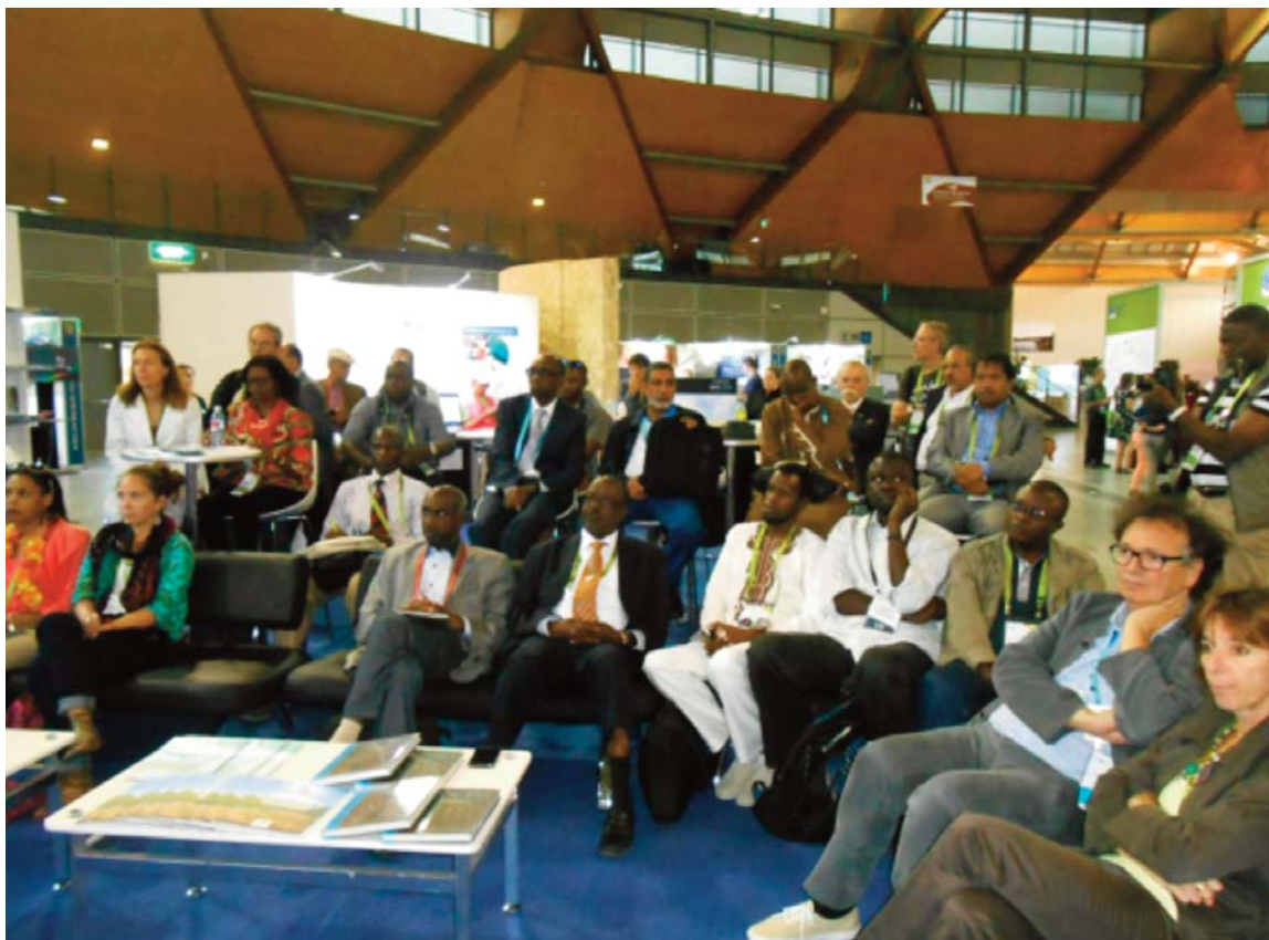
Les partenaires et membres à l'anniversaire du PRCM à Sydney à l'occasion du Congrès Mondial des Parcs

A Sydney, en Australie, le PRCM, s'est associé aux autres acteurs sous-régionaux, notamment le RAMPAO, la FIBA, l'UICN et le WWF, afin de coordonner et appuyer la participation d'acteurs ouest-africains au Congrès Mondial des Parcs du 12 au 19 novembre. Au total ce sont 10 acteurs et personnalités politiques qui ont pu bénéficier de cet appui. Dans le cadre de cette participation, plusieurs activités ont été organisées par le PRCM et ses partenaires notamment des communications, et des side-events.