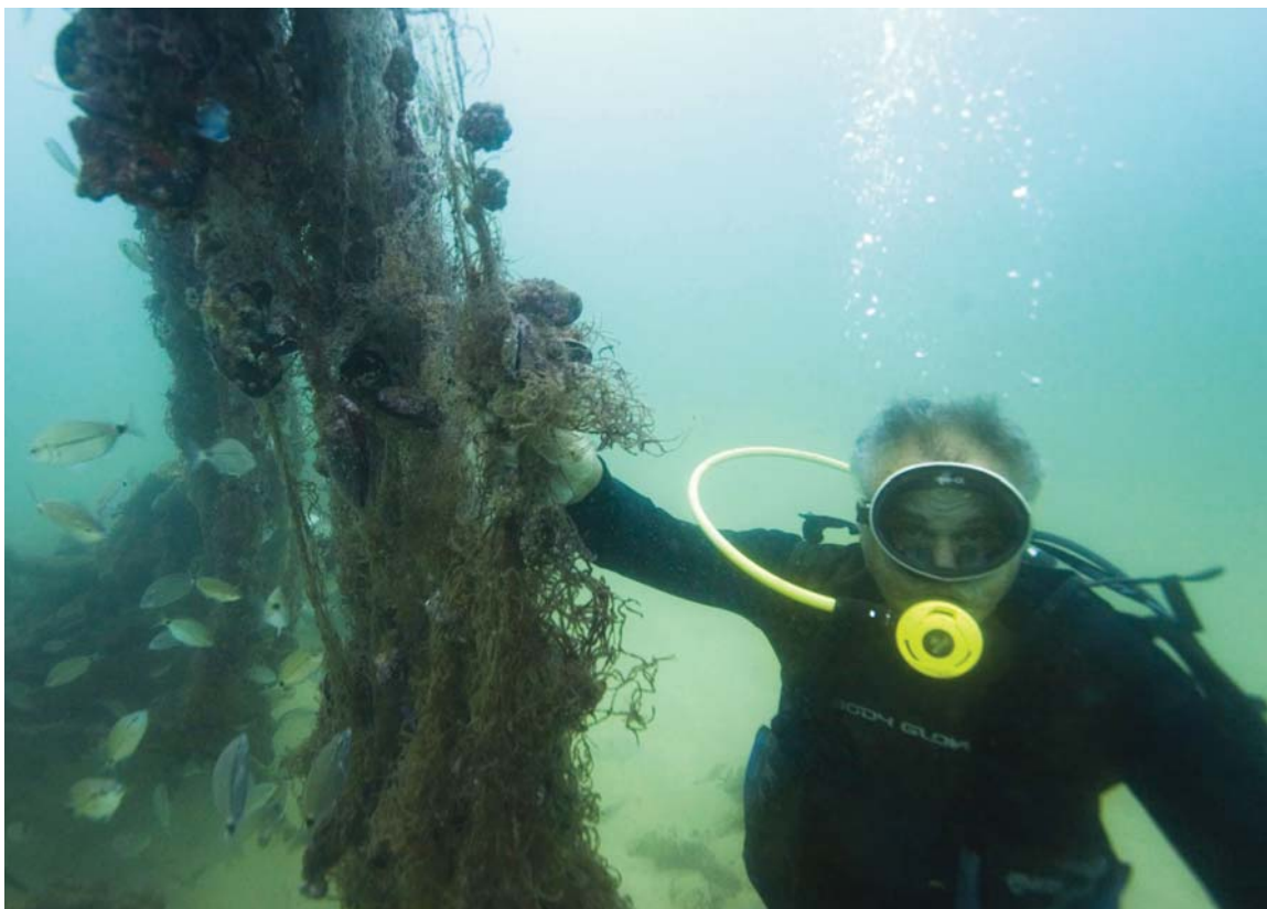
Retrait d'un filet de nylon par un plongeur

de noter que sur les 16 000 embarcations de pêcheurs artisans que compte officiellement le Sénégal, la majorité d'entre elles utilisent ces filets. A cause de la diminution des stocks de poissons, les pêcheurs artisans jettent leurs filets à proximité des fonds rocheux et des épaves, là où la concentration de poissons est plus importante. Bien souvent, ces derniers s'accrochent au relief ou tout autre support présent dans les fonds sous-marins. Ne pouvant être remontés, ils sont abandonnés par leurs propriétaires, accentuant ainsi la pollution marine et le phénomène de « pêche fantôme » de nombreuses années après l'abandon du filet par les pêcheurs.