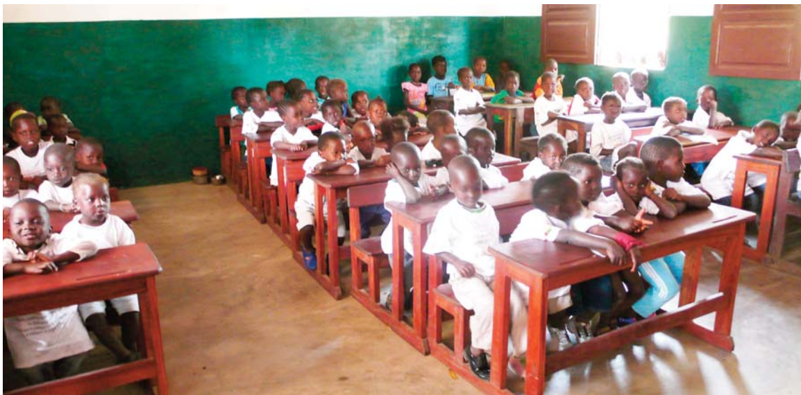
Une école dans le Parc National d'Orango (Guinée-Bissau)

En 2014, la promotion de l'éducation environnementale a enregistré un pas décisif avec le lancement de la 2 ème phase du PREE en décembre à Bissau.