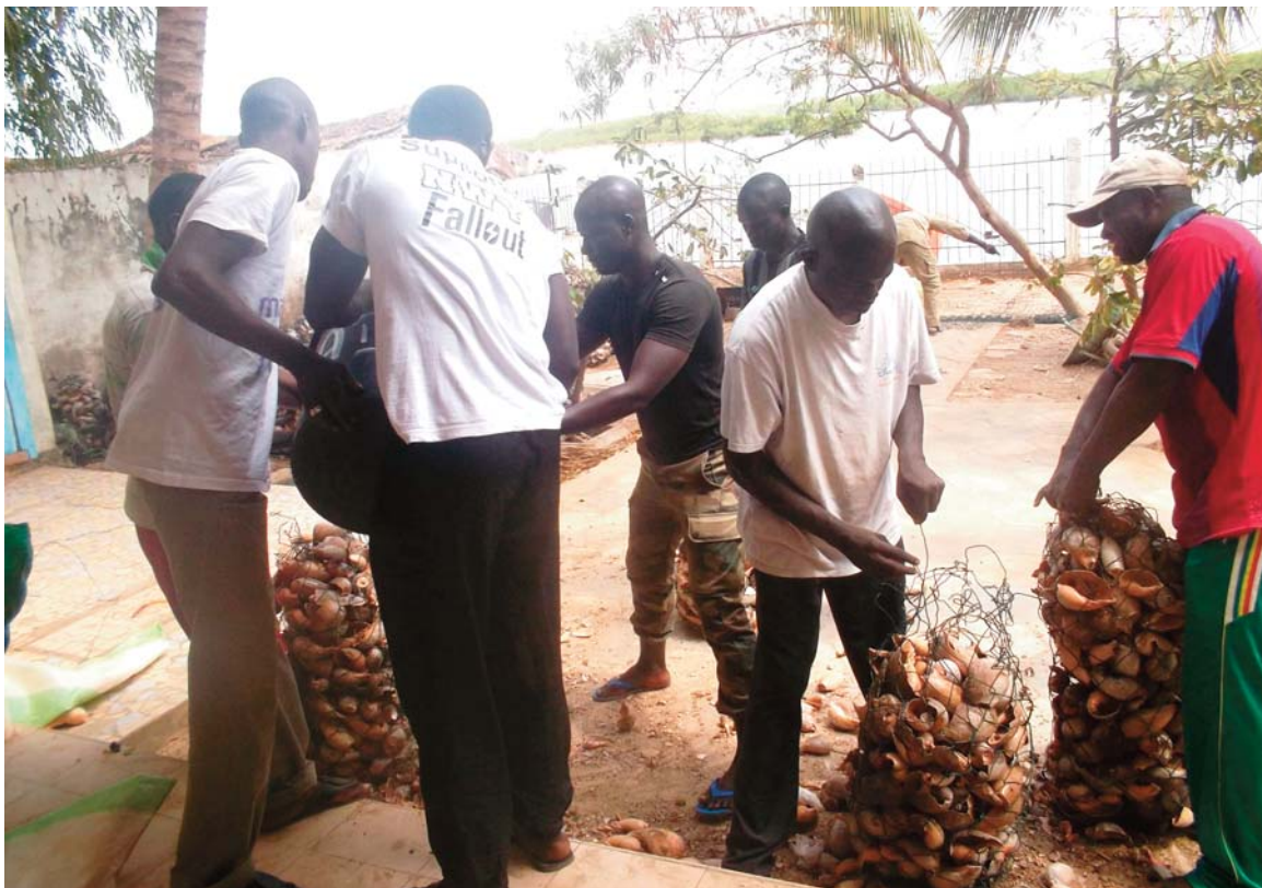
Fabrication de récifs artificiels pour ensemercer les vasières à Joal Fadiouth

sont pas encore mesurables mais les résultats prévus de ces actions permettront à la fois d'augmenter la productivité des vasières en ressources conchyliques, sources de revenus pour les femmes exploitantes, mais aussi de contribuer fortement à la réhabilitation de ces habitats naturels. La dynamique participative autour du projet et de l'AMP en général est jusqu'à présent exemplaire et représente un potentiel de démonstration susceptible d'encourager des initiatives similaires dans le pays.