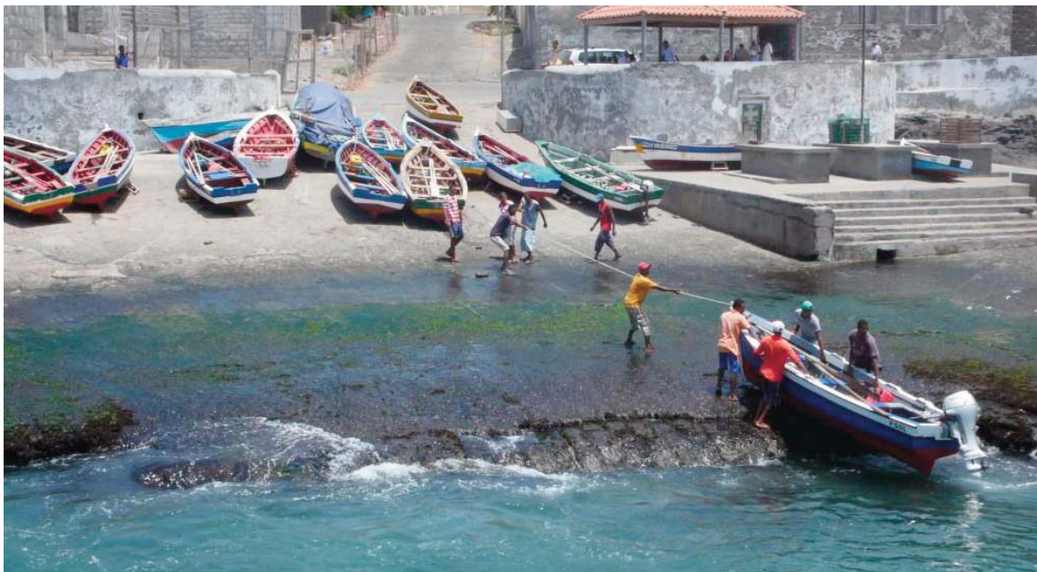
Barques de pêche artisanale au Cabo Verde

Avec l'appui du PRCM, la Confédération Africaine des Organisations Professionnelles de la Pêche Artisanale - COAPA a également organisé en marge de la célébration de la journée mondiale de la pêche, 4 panels sur (1) la mise en oeuvre des directives internationales volontaires pour une pêche artisanale durable, (2) les accords de pêches en Afrique, (3) les effets et impacts des changements climatiques dans le secteur de la pêche et (4) le système de financement innovant de la pêche artisanale. Une cinquantaine de participants provenant des pays composés des délégations des pays membres de la Confédération africaine des Organisations de la Pêche artisanale (CAOPA), des représentants des partenaires techniques et financiers, des gouvernements mauritaniens et sénégalais, des organisations professionnelles, du Réseau des Journalistes pour la Pêche responsable en Afrique de l'ouest (REJOPRAO) étaient présents à l'atelier.