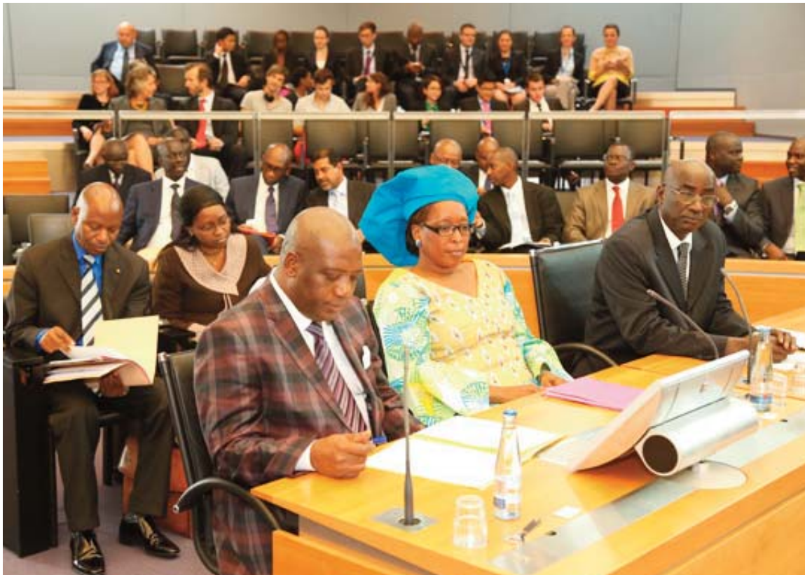
La délégation ouest africaine conduite par la CSRP lors de la phase orale du processus de saisine @CSRP

renforcer les capacités d'intervention des organisations membres du PRCM dans la conservation de la zone côtière et marine en Afrique de l'ouest à travers un appui pour la formulation de projets innovants et pertinents. Un appel à proposition pour l'identification de projets innovants a été lancé durant le 3ème trimestre de 2014. Une présélection a permis de retenir quatre concepts sur les vingt et deux propositions reçues, dont les promoteurs ont bénéficié d'un appui technique pour le recadrage du concept et d'un appui financier pour faire face au frais inhérents du développement de documents de projets répondants aux normes et standards des principaux bailleurs connus.