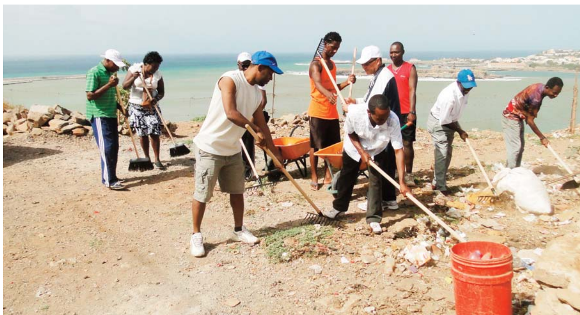
Une des séances de nettoyage des déchets plastiques initiées par ADAD au Cabo Verde

Outre les filets de nylon, les déchets des sachets plastique ont pris une dimension alarmante tant au plan de leur impact sur les écosystèmes marins que sur les communautés, dans toute la sous région ouest africaine. L'ONG Associação para a Defesa do Ambiente e Desenvolvimento (ADAD) avec le soutien financier de la MAVA et l'appui technique du PRCM, a décidé de s'attaquer à ce fléau au Cabo Verde.